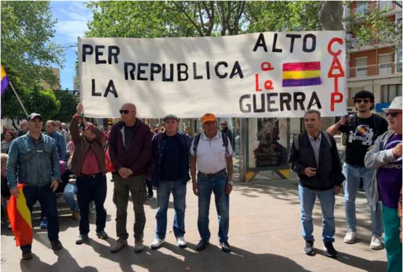
Miembros del CATP en Cataluña en una Manifestación por la Republica reclaman ¡Alto a la Guerra! el 16 de abril de 2023

¡Alto a la Guerra! ¡Alto el fuego inmediato, sin condiciones!